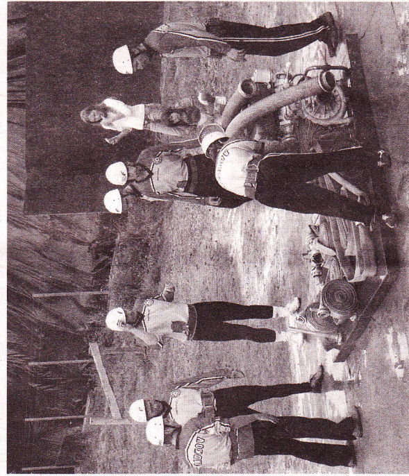
ČERVENOŠEDÍ ĎABLÍCI. Dobrovolní hasiči z Radkova nosí na dresu ohnivého ďábla.

mohou Radkovští pochlubit, když soutěžili v Příbyslavi. Tam zaběhli svůj rekord,